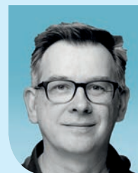
Marc Wirbeleit Facebook